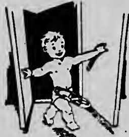
„Waarom is er nog geen kinderhoekje?"